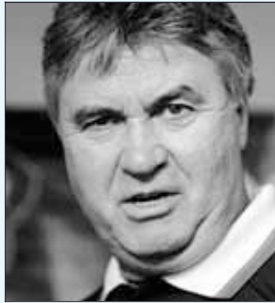
■ Guus Hiddink

Hiddink laat zijn verhalen over de be-e EK-kwalificatie-ijd van Rusland te-geland. In het NOS urnal legt de bonds-an Rusland uit dat eg morgen móét win-nog kans te maken ndronde van het EK iteraard ook aan-or de laatste voor-ge van Oranje op langrijke EK-duel tegen Slovenië in ven.